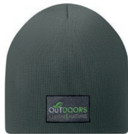
MW1101 MW1101 Gorro de doble capa. 50% RPET + 50% acrílico, 55 gr. Medida: 20x21,2cm.