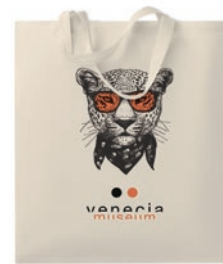
Marketa + MO9847

Bolsa de la compra de algodón con asas cortas. 140gr/m 2 . Producido bajo certificado estándar para controlar el uso de sustancias nocivas en textil.