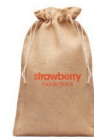
Jute Large MO9930

Bolsa de la compra realizada en yute con asas de algodón.