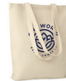
Fresa Soft MO9639

Bolsa rejilla para comida de algodón (140gr/m 2 ) por un lado, y de rejilla de algodón (110gr/m 2 ) y cuerda en la parte superior para el cierre de la bolsa. Producido bajo certificado estándar para controlar el uso de sustancias nocivas en textil.