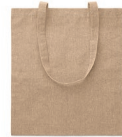
Cottonel Duo MO9424

Bolsa de la compra denim de 50% algodón reciclado y 50% algodón con asas largas. 250 gr/m 2 .