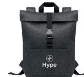
Indico Pack MO6456

Organizador de viaje de fieltro RPET con 2 compartimentos interiores y 4 exteriores.