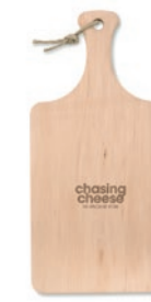
Ellwood Lux MO9624

Tabla de cortar ovalada de madera con corteza.