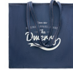
Style Tote MO6420

Bolsa de cuerdas denim 50% algodón reciclado y 50% algodón. 250 gr/m 2 .