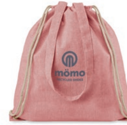
Moira Duo MO9603

Bolsa de la compra jaspeada de algodón y poliéster reciclado con cuerdas y asas largas. 140 gr/m 2 . Este artículo puede encogerse después de imprimir.