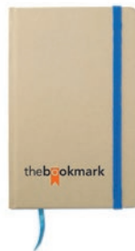
Evernote MO7431 Libreta A6 de material reciclado con 96 hojas blancas con marca páginas de color y banda elástica a juego.