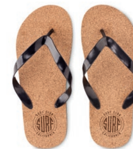
Bombai L MO6403

Bolsa de corcho para portátil de 14 pulgadas con solapa con cierre magnético.