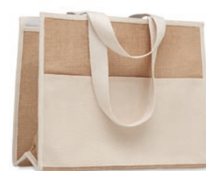
Campo De Geli MO6160

Bolsa de la compra en canvas y yute con interior laminado, con cierre de velcro, frontal con bolsillo de canvas y asas largas de algodón.