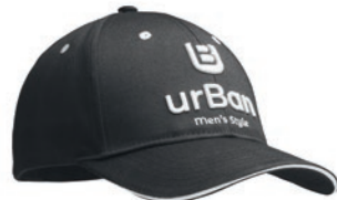
MH2103 MH2103 Recycled PET fabric Cap heavy cotton with sandwich.