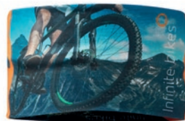
MH3101 MH3101 Cinta para la cabeza unisex y a todo color, hecha de PET reciclado y elástico.