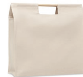
Mercado Top MO6458

Bolsa de la compra de algodón orgánico con asas largas. 140 gr/m 2 . Producido bajo certificado estándar para controlar el uso de sustancias nocivas en textil.