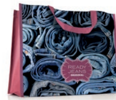
MO4070 Bolsa de compra horizontal con asas largas del mismo material o asas en PP webbing.