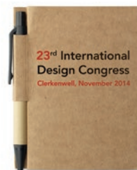
Cartopad MO7626 Libreta de bolsillo en material reciclado y 80 hojas. Incluye pequeño bolígrafo con tinta azul