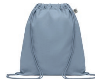
Yuki Colour MO6355

Envoltorio reutilizable de tamaño mediano de algodón orgánico para guardar alimentos. 140 gr/m 2 .