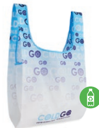
MB1111 Bolsa de compra plegable de RPET con bolsillo interior.