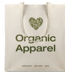
Organic Cottonel MO8973

Bolsa de la compra de algodón orgánico con asas largas. 105 gr/m 2 . Producido bajo certificado estándar para controlar el uso de sustancias nocivas en textil.