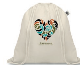
Organic Hundred MO8974

Bolsa de cuerdas de algodón orgánico. 140 gr/m 2 . Fabricada con algodón orgánico certificado.