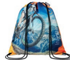
MB3111 Bolsa de cordones de PET reciclado.