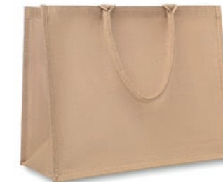
Brick Lane MO8965

Bolsa de la compra o de la playa laminada de yute con asas cortas de algodón.