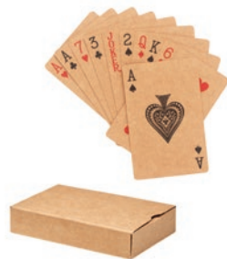
Aruba + MO6201 Baraja francesa de 54 cartas de papel reciclado, presentada en estuche de papel.