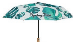
MU2006 MU2006 Paraguas plegable a 3 tiempos de 21" con mango de madera.