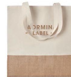
India Tote MO9518

Bolsa de la compra en canvas y yute con interior laminado, con cierre de velcro, frontal con bolsillo de canvas y asas largas de algodón.