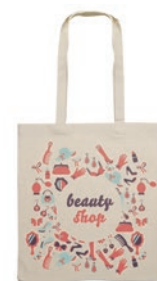
Cottonel + MO9267

Bolsa de la compra de algodón con asas cortas. 140gr/m 2 . Producido bajo certificado estándar para controlar el uso de sustancias nocivas en textil.