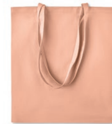
Zimde Colour MO6189

Bolsa de la compra de algodón orgánico con asas largas. 140 gr/m 2 . Hecho de algodón orgánico producido bajo etiqueta certificada.