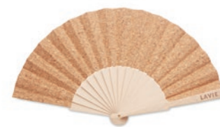
Fanny Cork MO6232

Chanclas de playa con superficie con una pared de bambú transpirable y suela de EVA . Tiras de PVC. La talla L se ajusta a la 40-43.