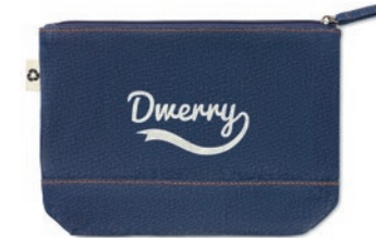
Style Pouch MO6421

Bolsa de la compra jaspeada de algodón y poliéster reciclado con asas largas. 140 g/m 2 . Este artículo puede encogerse después de imprimir.