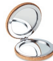
Guapa Cork MO9799

Abanico de madera con revestimiento de tela de corcho.