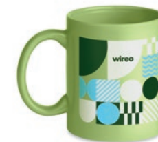
Dublin Tone MO6208

Taza de cerámica de 300 ml de capacidad. Presentado en una caja de regalo de cartón individual.