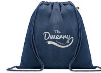
Style Bag MO6422

Bolsa de la compra jaspeada de algodón y poliéster reciclado con cuerdas y asas largas. 140 gr/m 2 . Este artículo puede encogerse después de imprimir.