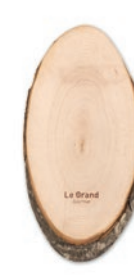
Ellwood Runda MO8862

Tabla de madera con corteza en forma ovalada de tamaño mediano y fabricada en la UE de madera Adler. Hecho de 1 trozo de madera. La medida puede variar de una unidad a otra.