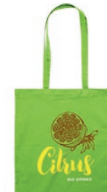
Cottonel Colour + MO9268

Bolsa de la compra en algodón 140 gr/m 2 con asas largas. Producido bajo certificado estándar para controlar el uso de sustancias nocivas en textil.