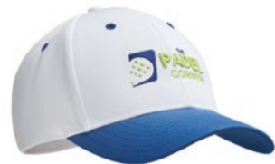
MH2101 MH2101 Recycled PET fabric Cap.