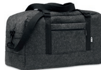
Indico Bag MO6457

Bolsa de cuerdas de fieltro RPET con cuerdas de poliéster.