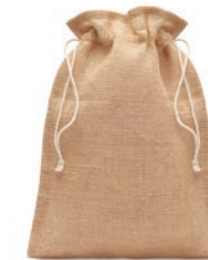
Jute Medium MO9929

Bolsa grande para regalo de cuerdas de yute. Tamaño aprox. 30 x 47 cm.