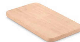
Petit Ellwood MO8860

Tabla de cortar con mango y cuerda para colgar, fabricada con madera de aliso de la UE.