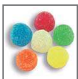
perlas de goma