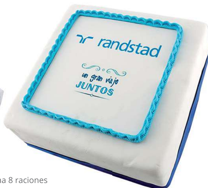
Tarta Artesana 8 raciones