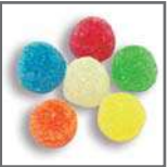
perlas de goma