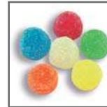
perlas de goma