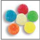
perlas de goma