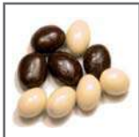
cacahuets con chocolate