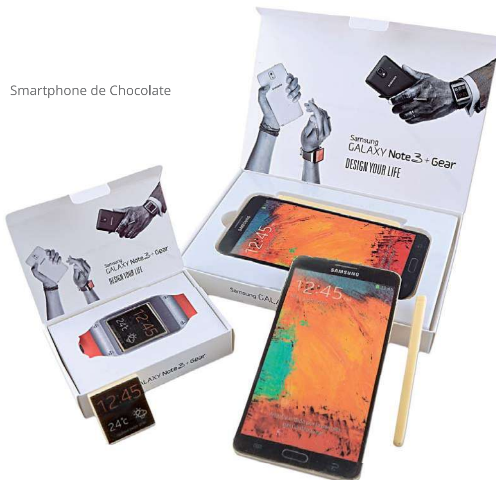
Smartphone de Chocolate

Productos desarrollados en base al destinatario, tipo de campaña, presupuesto, cantidad, etc. Adaptamos y damos forma a cualquier tipo de idea. No dude en preguntar.