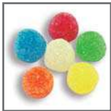
perlas de goma