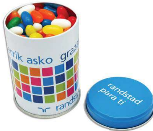
caramelo 2 lazos