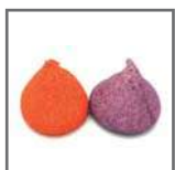
top mallow (solo en tamaño grande)