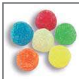
perlas de goma