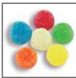
perlas de goma