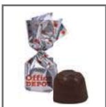
bombón 1 lazo