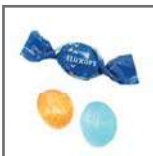
caramelos 2 lazos mini