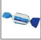
caramelo 2 lazos